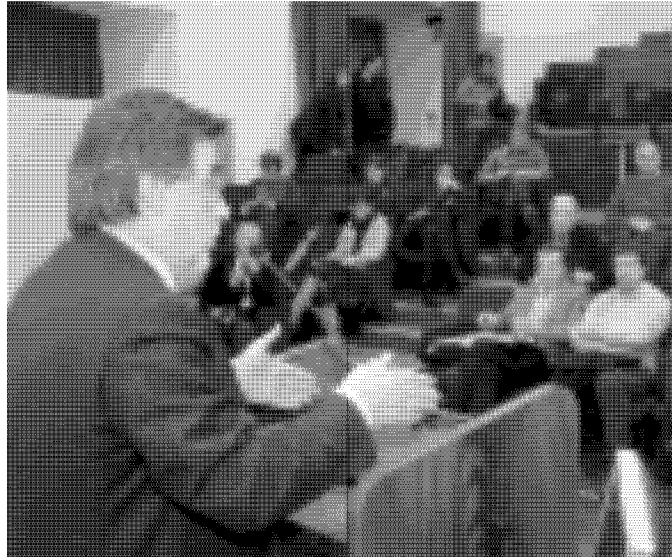
La riunione nella sede della Provincia a Mestre